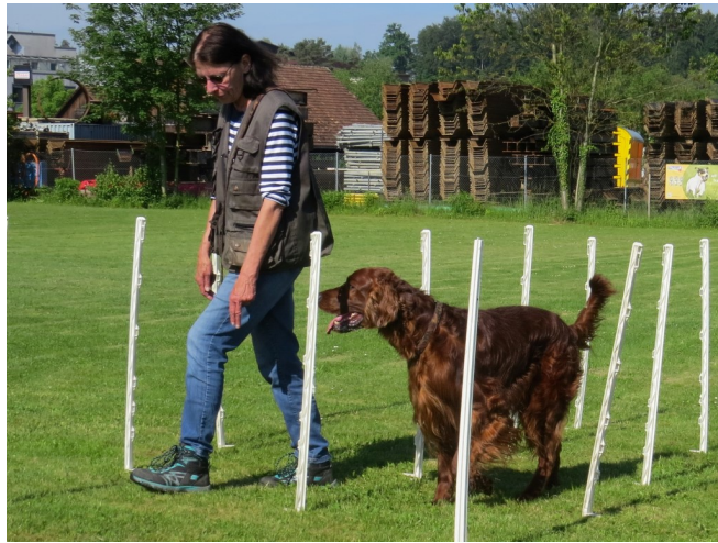
Impressionen Training Spass Sport Trainingsgruppe Samstag 2018-2020